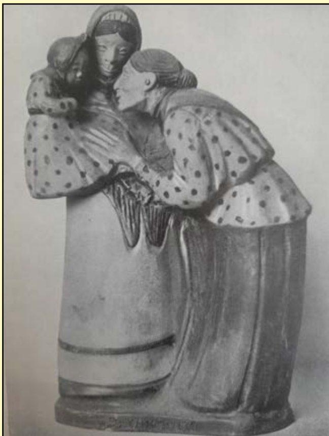
Terracotta buste van beeldhouwer Joseph Mendes da Costa, collectie Joods Historisch Museum Amsterdam.